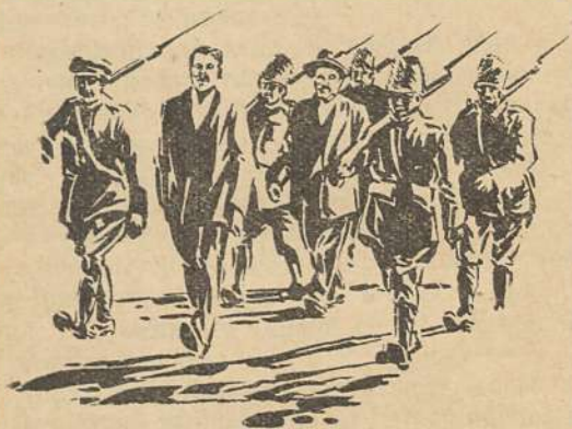
Talod viidi punaväelaste vahel Võrru. (Vt. lhk. 44.)